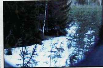
В объективе видеоловушки лиса.

В летнее время эту кормушку снежный человек навещал ещё однажды, но уже в одиночку. Расположился с ней по соседству в зарослях мелкого сосняка, при этом он наломал деревья, и оборудовал поляну для своего отдыха. Съеден был не весь корм, а всего лишь треть содержимого кормушки. Трудно сказать самец это был или самка, но после ухода от него осталась большая куча фекалий в центре этой поляны. После того, как я начал устанавливать для съёмки видеоловушки, посещения кормушки прекратились. Кто только не попадался в объектив камеры, но только не снежный человек. В дальнейшем леший всё-таки пользовался приманками, как из этой, так и из других кормушек, но делал это скрытно и неохотно. Возможно, овёс для него не такое лакомство, ради которого он способен сломя голову бежать из чащи и уплетать его, позируя перед камерой. Наш леший существо всеядное, способное питаться ягодами и травой, рыбой и мясом, но добывать себе еду он предпочитает в среде обитания собственным промыслом, а не лазить по охотничьим кормушкам или деревенским помойкам.