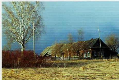
Деревня Аксёново. Весной в 2009 году часть деревни уничтожил пожар. Дотла сгорела и моя изба.

Я купил две деревенские избы в исследуемом районе и оборудовал их под научные базы. В северной части это был посёлок Разбойный Бор, в южной – деревня Аксёново. Отсюда я совершал походы в тайгу, сплавлялся по рекам, носил приманку к устроенным в лесу кормушкам. Когда находил в тайге непонятные конструкции из деревьев, по-особому загнутые стволы, надломленные ветки, странные следы и предметы, то всё это фотографировал и отправлял по электронной почте в Москву. Игорь Бурцев, общаясь с американскими коллегами, демонстрировал им наши снимки, а они, для сравнения, присылали свои. Оказалось, что их бигфуты оставляют в своих заокеанских лесах точно такие же свидетельства, как наши лешие в вятских лесах. Получалось, что одно и то же существо, один и тот же животный вид, обитающий на разных континентах, ведёт себя совершенно одинаково, имеет одни и те же повадки, живёт по одним и тем же лесным законам. Всё это было для нас чрезвычайно важно. Думаю, не менее значимо это было и для американских искателей бигфутов. Фактически это обстоятельство лишний раз доказывало – снежный человек не есть бестелесный фантом из потусторонних порталов, а это обыкновенный биологический объект, реально существующий в нашем материальном мире.