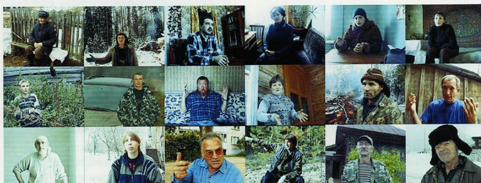
Некоторые из свидетелей, видевшие снежного человека в районе поиска.

Пожалуй, неуязвимость, скрытность и осторожность основа их выживаемости. Они стараются не оставлять следов своего присутствия, не поддаются на приманки и при малейшей возможности быть увиденным, немедленно скрываются в лесу. Эта особенность поведения нашего гоминоида абсолютно схожа с поведением подобных ему собратьев обитающих в Гималаях и на Кавказе, в Азии и в Африке, а так же и в других уголках планеты, но только не в Северной Америке. Почему-то в последнее время из Соединённых Штатов стало поступать множество странных сообщений о заигрывании сасквачей с людьми, об их панибратском отношении с человеком. Якобы бигфуты приходят на фермы, просят у хозяев еду, и чуть ли не распивают пиво с хозяевами, употребляя при этом английские слова и выражения. Если это не фальсификация, то хотелось бы в доказательство увидеть не расплюсценные пивные банки от руки бигфута, а чёткие фотоснимки этих исторических встреч. Ведь человечество до сих пор не верит в его существование, и официальная