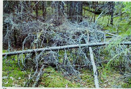
Согнутые и поваленные ёлки - «диван».