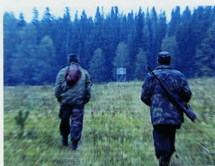
Охотники вернулись, но медведь исчез.