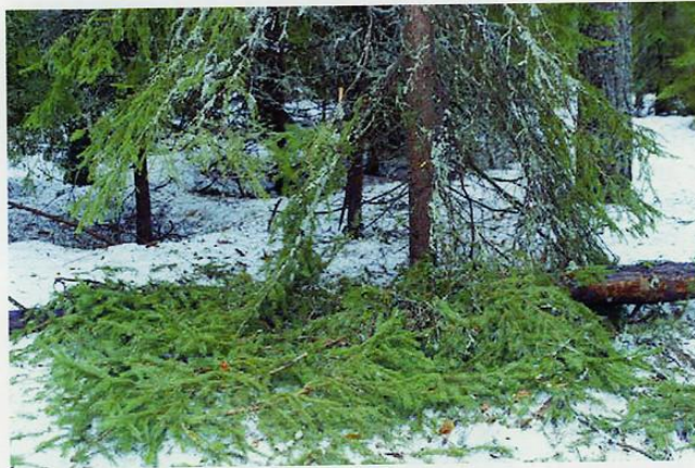
Лежанка на снегу, устроенная из лапника.