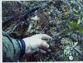
Наличие овса в фекалиях.