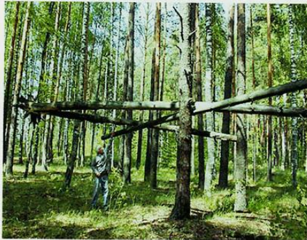
Конструкция из огромных лесин, раскреплённых между стволами деревьев - заслон.