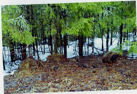
Полноценная лежанка с двумя подголовниками.

Этот случай помог мне выбрать место под устройство кормушки. Она была сооружена в той части леса, куда убежал снежный человек. И я не ошибся в выборе. Кормушка находилась на высоком берегу реки Вятки рядом с оврагом. Весной, когда я пошёл проверять кормушку, снега в лесу было много, но он уже начал таять. Звери пробуждались от зимней спячки. На краю этого оврага я обнаружил необычную лежанку. Она была устроена метрах в двухстах от кормушки. Среди снега из сухой травы, непонятно, откуда принесённой, была уложена настоящая перина с двумя подголовниками. Судя по размерам и пролежням в сене, здесь отдыхали два мощных существа, вероятно, самец и самка, причём спали они на этой лежанке, вытянувшись в полный рост, как спят люди. Никто из крупных зверей: лось, кабан, медведь – не сооружает ничего подобного. Чтобы в тайге смастерить «кровать с подушками», нужно иметь не только руки, но и мозги. Пройдя еще сотню метров, на выходе из леса, я обнаружил вторую лёжку, поменьше. Она была выполнена по той же «технологии» и служила наблюдательным пунктом.