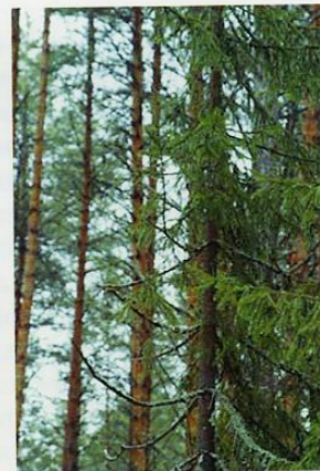
Ветки сломаны на высоте 3 м.

полностью утратил контроль над своим мозгом. Ничего не соображая и с трудом переставляя ноги, я побрел неведомо куда в буквальном смысле на «автопилоте». Не помню, как мне удалось добраться до своей избу, но даже там я не сразу пришел в себя. Почувствовал улучшение здоровья лишь утром, но остался еще на сутки отлеживаться дома. Окончательно придя в себя, я понял, что помешал отдыху двум человекоподобным существам, которые оказали на меня психическое воздействие и выдавили со своей территории. Теперь мне было понятно, как леший заставляет путника сутками блуждать и ходить кругами по лесу. За весь период исследований я ещё дважды подвергался подобному воздействию, но уже с менее болезненными последствиями.