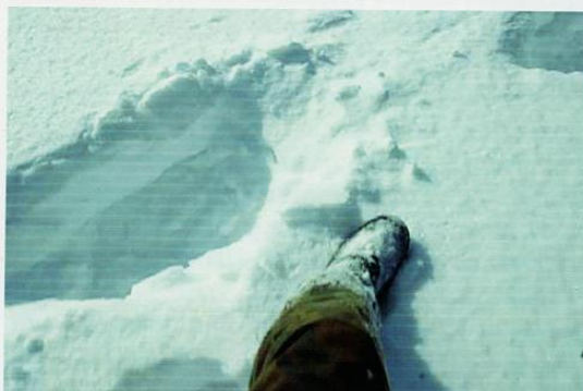
Следы на снегу.