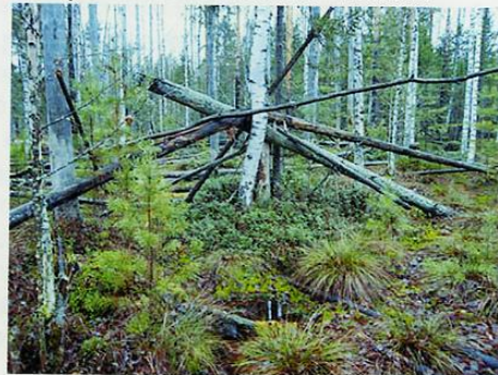
Конструкция в форме пирамиды - тити.