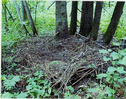
Гнездо - лёжка в лесу, сплетённая из веток.