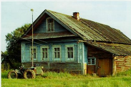
Изба в посёлке Разбойный Бор.