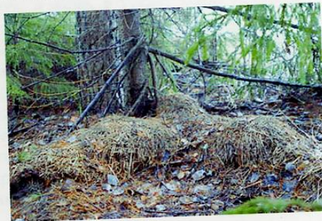
Лёжка - наблюдательный пункт.

Могучие еловые ветки хорошо маскировали её с наружной стороны. С этой точки можно было следить за моей кормушкой, она была словно на ладони. Только леший так грамотно мог организовать наблюдение, никакое другое животное на это не способно.