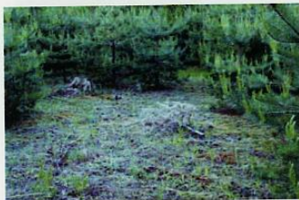
Поляну в сосняке устроил леший.

полностью утратил контроль над своим мозгом. Ничего не соображая и с трудом переставляя ноги, я побрел неведомо куда в буквальном смысле на «автопилоте». Не помню, как мне удалось добраться до своей избу, но даже там я не сразу пришел в себя. Почувствовал улучшение здоровья лишь утром, но остался еще на сутки отлеживаться дома. Окончательно придя в себя, я понял, что помешал отдыху двум человекоподобным существам, которые оказали на меня психическое воздействие и выдавили со своей территории. Теперь мне было понятно, как леший заставляет путника сутками блуждать и ходить кругами по лесу. За весь период исследований я ещё дважды подвергался подобному воздействию, но уже с менее болезненными последствиями.