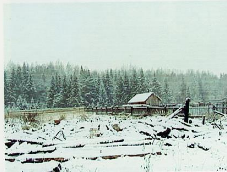
Леший пометил избу и она сгорела.