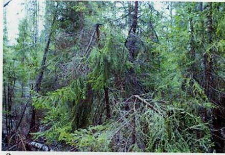
Заломанные верхушки ёлок - маркеры.