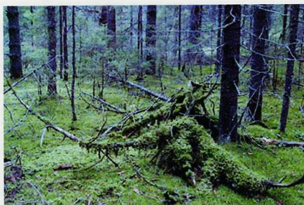
Сюда был притащен труп медведя и объеден.

Произошёл у нас и другой случай, когда леший обхитрил охотников, и мне с егерями пришлось подробно разбирать это происшествие. Была охота на овсах. В полночь медведь вышел на овсяное поле, и охотники с лабаза застрелили его. Посмотрев в оптику прибора ночного видения, они убедились, что мишка не дышит. На всякий случай произвели контрольный выстрел, спустились вниз и, окончательно убедившись, что он мертв, отправились за собаками и машиной. Пока ходили, прошло минут сорок. Вернувшись обратно, охотники удивились – медведь исчез. Следы волочения уходили в лес. Пустили собак по следу. Собаки привели охотников к пропаже. Труп был утащен на 40 метров в лес. Волокли его через густой ельник, проделав целую просеку. Весил медведь килограмм 160. Собаки остановились у тела и далее не пошли, поджали хвосты и даже не тявкали. Такого поведения от них егерь не ожидал. Обе собаки, были приученные ходить на медведя, но в этот момент они явно боялись и жалась к людям. Неизвестное существо, похитившее трофей, не пыталось бежать и скрыться, оно находилось от них в тридцати метрах, как заметил один из охотников: «Он стоял, и смеялся над нами». Тело медведя было разорвано, шкуру рвали в районе плеча, где прошла навывлет пуля. Мясо было покусано, сочилась кровь, были видны вытянутые зубами жилы. Всего мяса было выедено примерно с ведро. Охотники решили, что другой медведь не мог этого сделать.