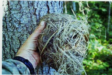
Скатанный мячик - игрушка детёныша.