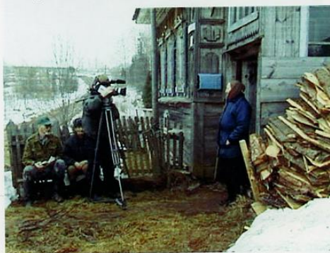
В хутор Свобода приходил леший.