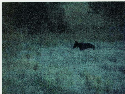
В полночь на овсяное поле вышел медведь.