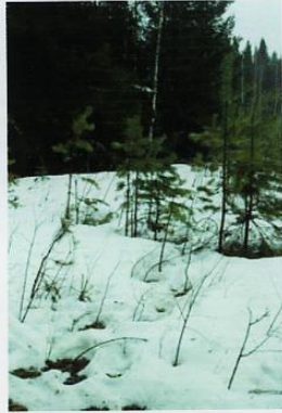
Следы к кормушке.

Отсюда к моей кормушке тянулась вереница следов. К сожалению, весеннее солнце сделало своё дело, снег на поляне раскис, а местами и вовсе растаял. Чётких отпечатков не было, но по характеру следов было ясно – здесь ходили крупные существа. Дальнейшее обследование показало, что всё содержимое кормушки, а это килограммов двадцать овса, было вынута из неё и съедено. Так аккуратно собрать зерно из поддона ни медведь, ни какой другой зверь не мог, т.к. он находился на высоте 2,3 м от земли. Недалеке я обнаружил шесть куч кала с наличием в нём переваренного овса.