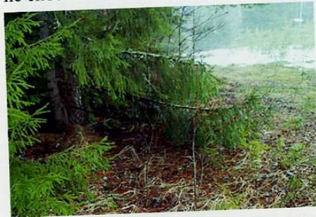
С этой точки лешие вели наблюдение за моей кормушкой.

Могучие еловые ветки хорошо маскировали её с наружной стороны. С этой точки можно было следить за моей кормушкой, она была словно на ладони. Только леший так грамотно мог организовать наблюдение, никакое другое животное на это не способно.