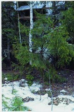
Кучи фекалий у кормушки.

Отсюда к моей кормушке тянулась вереница следов. К сожалению, весеннее солнце сделало своё дело, снег на поляне раскис, а местами и вовсе растаял. Чётких отпечатков не было, но по характеру следов было ясно – здесь ходили крупные существа. Дальнейшее обследование показало, что всё содержимое кормушки, а это килограммов двадцать овса, было вынута из неё и съедено. Так аккуратно собрать зерно из поддона ни медведь, ни какой другой зверь не мог, т.к. он находился на высоте 2,3 м от земли. Недалеке я обнаружил шесть куч кала с наличием в нём переваренного овса.